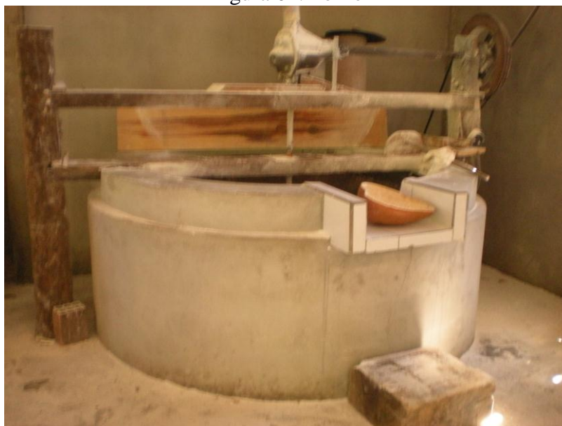
Figura 04: Forno

morena. Em todos os engenhos visitados o fornear era ou é uma atividade realizada por mulheres comprovando a tradição indígena segundo Pereira (idem).