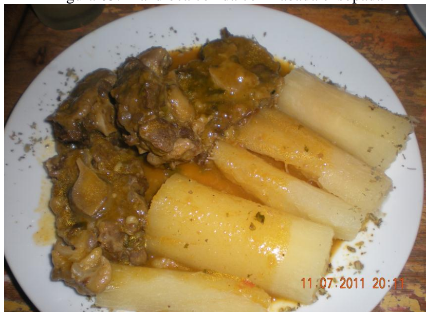
Figura 05: Mandioca cozida com rabada ensopada

ensopada, com caldo de peixe e até com leite. Depois de cozida e escorrida também pode ser frita e servida para consumo.