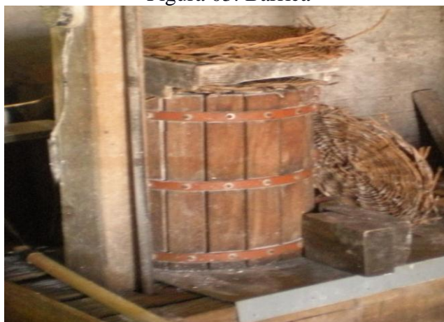
Figura 03: Barrica

Além do tipiti, nos engenhos de influência açoriana visitados durante a pesquisa foi possível observar outro equipamento utilizado para a prensagem, que foi a prensa de lagar de parafuso na qual a mandioca é prensada dentro de uma barrica, barril ou “barrili” (Figura 04) de madeira sem tampa nem fundo, onde este é cheio de massa.