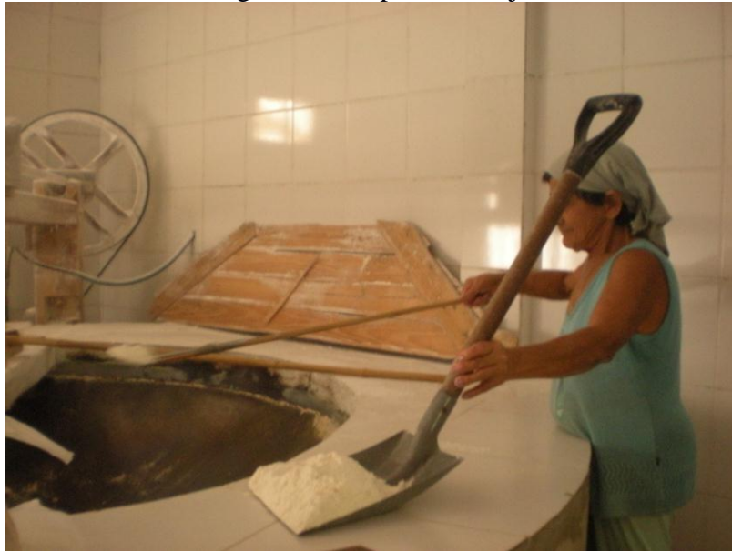
Figura 06: Preparo do beiju