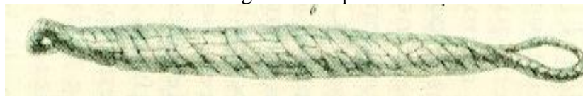
Figura 02: Tipiti